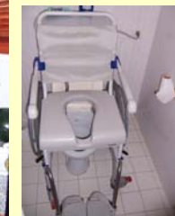
Toilette mit Dusch- / Toilettenrollstuhl