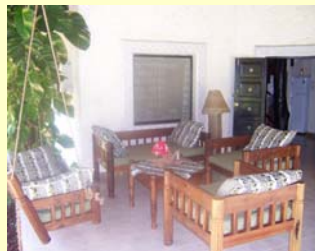
Sitzecke auf der Terrasse

Das Haus ist mit landestypischen Möbeln eingerichtet und man muss auf den gewohnten europäischen Komfort nicht verzichten.