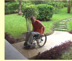
Auffahrrampe an der Terrasse