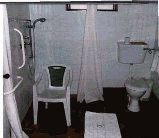
Villa Kusini: Wohnbereich, Schlafzimmer, rollstuhlgerechtes Bad.