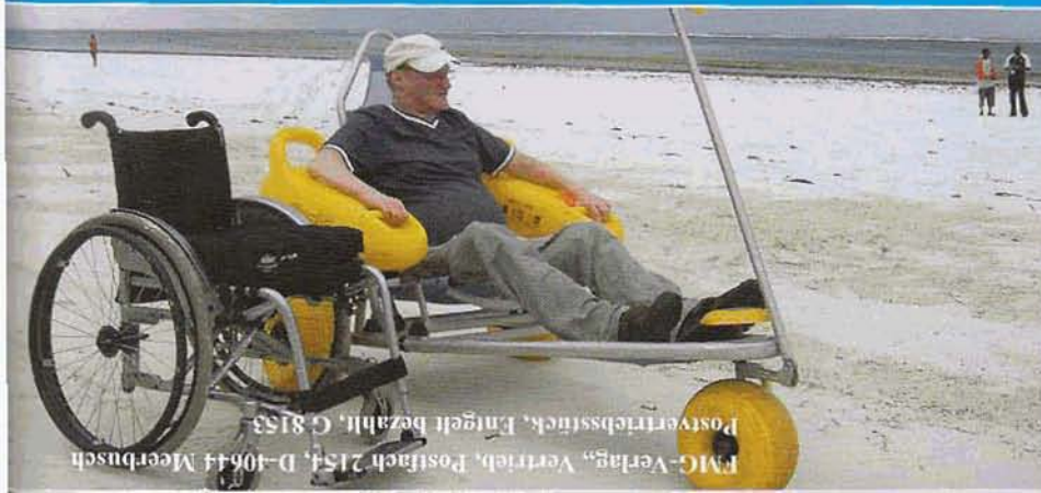
FMG-Verlag, Vertrieb, Postfach 2154, D-40644 Meerbusch Postvertriebsstück, Einzelstück bezahlt, G 8153

Große Übersicht: Die schönsten Reisen für Rollstuhlfahrer / Behinderte 2009