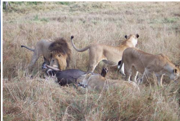
So ist die Natur: Löwen haben ein Gnu erlegt.