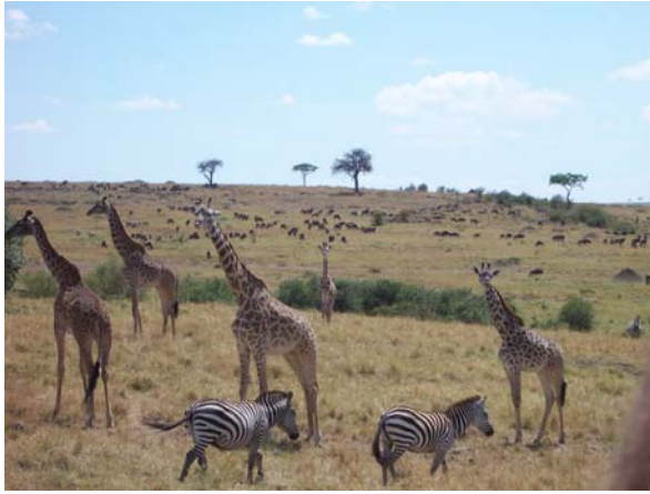
Zebras, Giraffen und im Hintergrund Gnus.